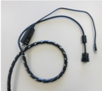
Kabelpeitsche des Whiteboards